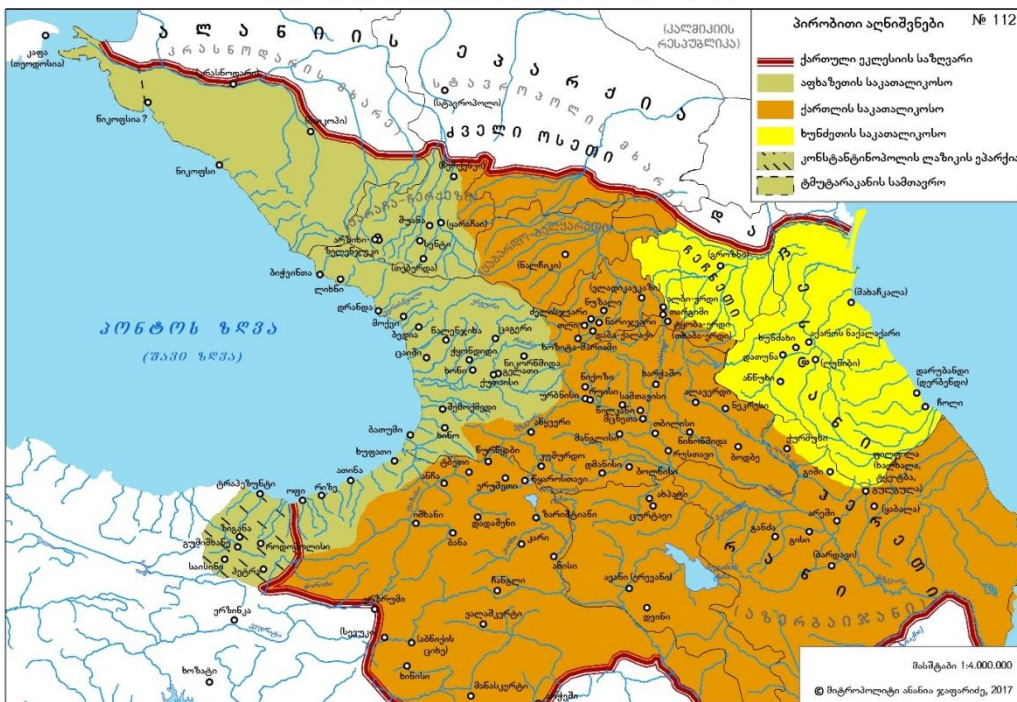
საპართევლოს ეკლესიის იურისდიქციის საზღვრები VII-XV სს-ში

ჩვენი აზრით, კიდევ უფრო მიუტყვებელ შეცდომას წარმოადგენდა აღნიშნული „საზოგადოების“ მოღვაწეობა ინგუშთა შორის. ინგუშები ჯერ კიდევ ქრისტიანები იყვნენ „კავკასიაში ქრისტიანობის აღმდგენელი საზოგადოების“ ინგუშეთში მოღვაწეობის დაწყებისას, დამთავრებისას კი ინგუშთა შორის არა თუ განმტკიცდა ქრისტიანობა, არამედ ისინი მაჰმადიანებად გადაიქცნენ.