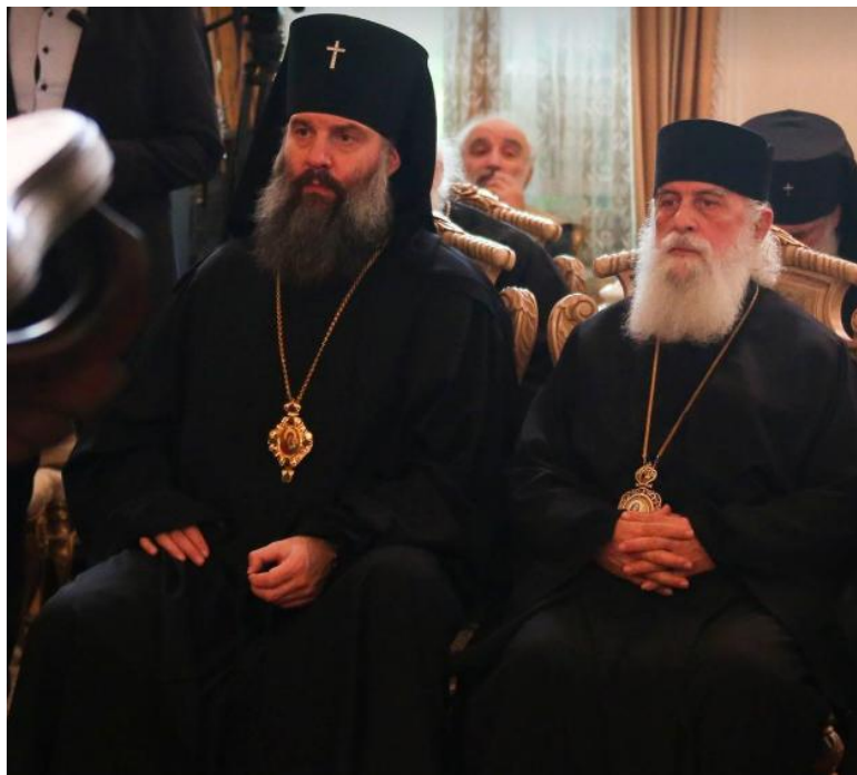
სრულიად საქართველოს კათოლიკოს-პატრიარქის მოსაყდრე სენაპისა და ჩხოროწყუს მიტროპოლიტი შიო (მუჯირი) და მანგლელი მიტროპოლიტი ანანიას (ჯაფარიძე)

The Holy Synod appointed him at Australia and New Zealand parishes on 30 April 2009. He became a metropolitan on 2 August 2010. He became a member of Canonization Commission of Georgian Church on 21 December 2010.