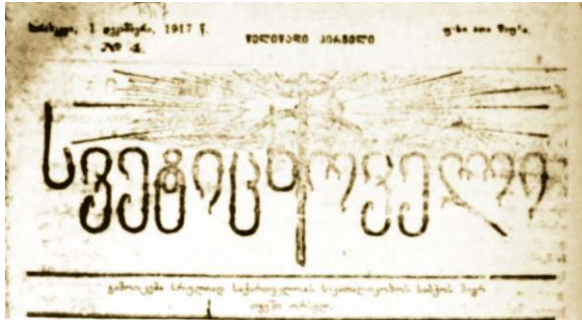
ჟურნალ „სვეტიცხოველი“, 1917 წლის დეკემბრის, ყდის ფრაგმენტი