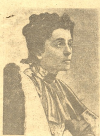
ელვირია დუშვა (1859—1924)

მთელი ქვეყნის ხელოვანთა და უბრალო მომაკე- დავთა ცრემლია- ნი თვალეში მიმა- რთულია დღეს შორეულ ამერი- კის ქ. პიტსბურგი- სკენ, საცა სამუ- დამოდ დაიხტეა 1859 წ., ოქტომ- ბრის 3, ფიგეფა- ნოში (პავიის პროვინციაში) ახე- ლილი დიდრონი, ძლიერის სვედით დატვირთული თვალეში უღეო-