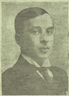
რეჟისორი ვ. მგაღლიშვილი (1884—1924)

კრება მისი როლებში გარდაცვალებიდან 10 წლის შესწორების სახსოვრად