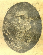
დ. აწყურელი, ევ. კლდიაშვილი, ა. იმედაშვილი