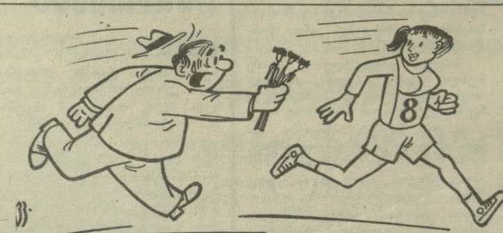
პანტანა კუციას ნახატები.