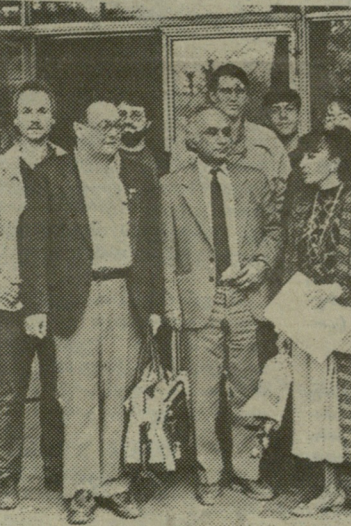
თითოეულ გუნდში 9 ვაჭი და 1 ქალია, თბილისის ჰარდაკის სისახლეში სტუმარ-მასპინძლები უკვე ორჯერ შეხვედრენ ერთმანეთს.

სტურუა) — ლოთარ არნოლდი 1:0 (0,5:0,5), იგორ ეფიმოვი — ხრისტოვ ფრომერი 1,5:0,5, ვია ბლანტურივი — მარტინ პრეისი 1,5:0,5, თამაზ ტაბატაძე — კურტ ბუში 1,5:0,5, დავით ჯანოვი (იანის პოპოვი) — მარტინ შრეპი 1:0 (1:0), რევზ კაკაბაძე — ბერნარდ სვირა 1,5:0,5, გივი გოგიანიშვილი — ხრისტან ბროსერი 1,5:0,5, კახა შალამბერიძე — ნორბერტ ბლუმი 1,5:0,5, ზაზა ხოფერიძე — პეტერ ბლანტურივი 0,5:1,5, ნინო ხუციანთა — ბეატე ბორი 1:1.