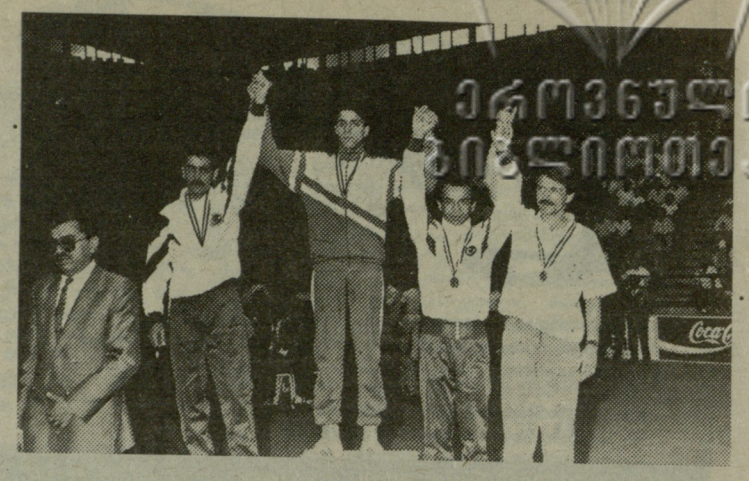
სტამბულიდან — ყველა სინჯის კედლით