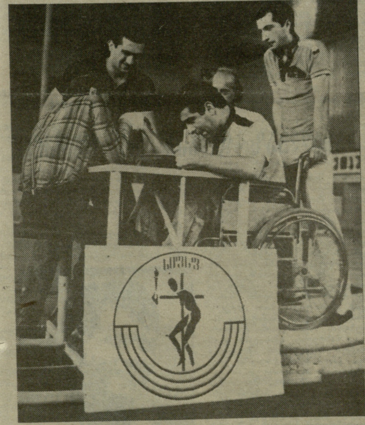
თბილისში ბავშვთა კალათბურთის სახალხოში ჩატარდა პირველი ერთგული ჩემპიონატი მკლავში ინვალიდთა შორის. სურათზე, რომელსაც გადავაზობთ, სწორედ ამ ასპარეზობის ერთ-ერთი მომენტია აღბეჭდილი. წერილს საინტერესოდ ჩატარებული ამ შეჯიბრების შესახებ „ლელოს“ უახლოეს ნომერში შემოგთავაზებთ.

მართული სპორტის დამოუკიდებლობისთვის სპორტსაზოგადოება „შეგარდენის“ რესპუბლიკური საბჭოს პლენუმი გამიარტა საქართველოს პროფკავშირების სპორტსაზოგადოება „შეგარდენის“ რესპუბლიკური საბჭოს პლენუმი, რომელმაც განიხილა სპორტსაზოგადოება „შეგარდენის“ წესდების პროექტი. წესდების პროექტი გამოქვეყნებულია გაზეთ „ლელოს“ 5 ივნისის ნომერში. პლენუმზე გამიარტა საინტერესო, საქმიანი საუბარი დამოუკიდებელი, ერთგული სპორტსაზოგადოების წესდების პროექტის გარშემო, რომლის მიღების შემდეგ სპორტსაზოგადოება „შეგარდენის“ ალარ იქნება საკავშირო საზოგადოების სტრუქტურაში, როგორც მისი ერთ-ერთი რეგიონალური ორგანიზაცია. წესდების მიღება კიდევ ერთი პრაქტიკული ნაბიჯი იქნება ქართული სპორტის სრული სუვერენიტეტის მოპოვების გზაზე. პლენუმმა მიიღო გადაწყვეტილება: სპორტსაზოგადოება „შეგარდენის“ რიგგარეშე ყრილობა მოიწვიოს მიმდინარე წლის 22 ივნისს. განისაზღვრა ყრილობაზე დელეგატთა წარმომადგენლობის ნორმა, დამტკიცდა ინსტრუქცია დელეგატთა არჩევის წესის შესახებ.