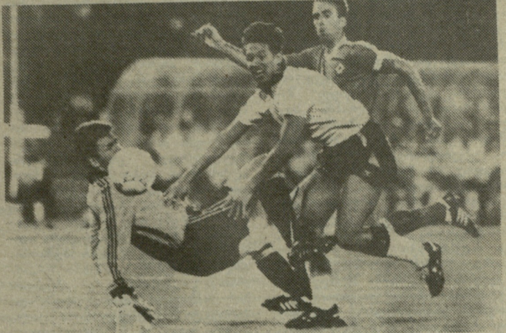
ინგლისი — ირლანდია. გარი ლინეკერის ამ დარტყმის შემდეგ ინგლისელებმა გახსნეს ანგარიში — 1:0.

სწორედ ასე შეიძლება ეწოდოს იტალიის ქალაქებში მიმდინარე მსოფლიოს XIV საფეხბურთო ჩემპიონატის დასაწყისს, რომლის შეხვედრებაც ესოდენ დიდი ინტერესით ვაძეგნებთ თვალს ყველანი. რატომ „კაპრიტი“? იმიტომ, რომ ჩემპიონატის დაწყებიდან სულ ათი-ოდე თამაში ჩატარდა და გათამაშების ცხრილები უკვე აკრულდა ყოველად მოულოდნელი, „უპროგნოზო“ ეფექტური შედეგებით. უკვე მოხდა სიურპრიზები და სენსაციებიც კი. სიურპრიზთა კატეგორიის მივყავთვინებდით სსრ კავშირისა და რუმინეთის, ბრაზილიისა და შვეიცარიის, კოსტა-რიკისა და შოტლანდიის გუნდების შეხვედრათა შედეგებს, მსოფლიო ჩემპიონატის არგენტინელების მარცხი კი კამერუნის გუნდთან აშკარა და თვალნათელი სენსაციაა. იმ მატჩებში, რომლებიც 11 ივნისამდე ჩატარდა, ფრეები გამოირჩეული იყო და მხოლოდ დიდი ბრიტანეთის წარმომადგენლებმა — ინგლისისა და ირლანდიის გუნდებმა გაიყვანეს თანაბრად ქულები — 1:1. ეს იყო მეტად საინტერესო, დაძაბული თამაში, ორივე გუნდი დაახლოებით ერთნაირი სტილით მოქმედებდა, ფეხბურთელები ერთნაირი სკოლის მიმდევარნი არიან, ამიტომაც