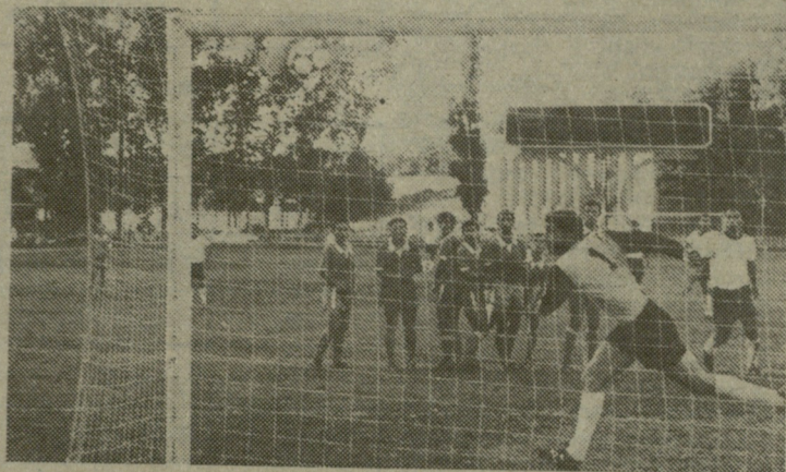
სურათზე: „გორდა“ — „მერცხალი“. შეხვედრის ერთი ეპიზოდი.

ერთი წუთის შემდეგ კოსტოშვილმა ლამაზი დარტყმით გახსნა ანგარიში — 1:0. „მერცხალმა“ გაშველული ბურთის შემდეგ საგრძობლად მოუმატა ტემპს, მაგრამ ეს დიდიხანა არ გაგრძელებულა, 45-ე წუთზე ფა-