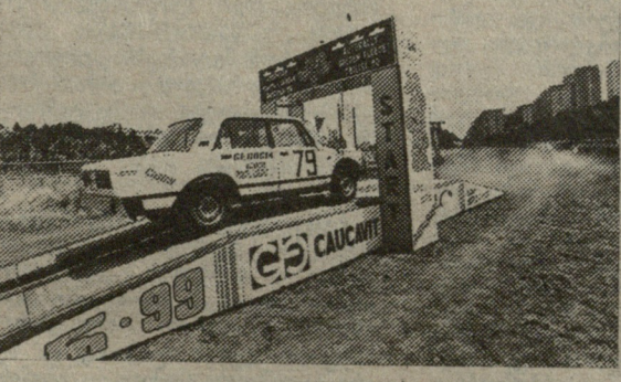
„ომარს სარმინი-90“ — ახეთი ეყო ოფიციალური სახელწოდება ავტორაბლისა, რომელიც ამ დღებში პირველად ჩატარდა თბილისში. ხსპარეზობის ორგანიზატორ გზ.

ჯიუ-ჯიუს დღეს ჩვენი რესპუბლიკის ექვს ქალაქშია დანერგილი. ამ სახეობის ფედერაციის აღმასრულებელმა დირექტორმა ავთანდილ მიქაიძემ გვაცხობა, რომ მომავალი წლის გაზაფხულზე შეიძლება ჯიუ-ჯიუს ქართველ და პოლონელ ოსტატთა ამახანაგური შეხვედრებიც მოეწყოს.