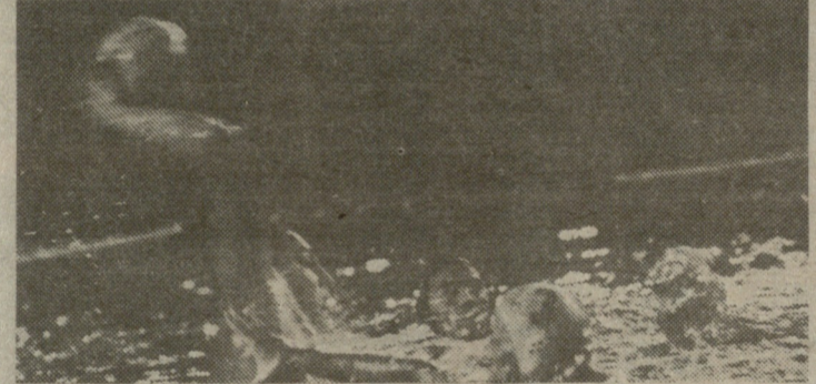
თბილისის „დინამოს“ და ვოლგოგრადის „სპარტაკის“ შეხვედრის მომენტი.

მეორე მატჩში თბილისის „დინამო“ შეხვდა ხარკოვის „ლოკომოტივს“. დამაბული ბრძოლა ფრედ — 12:12 დამთავრდა.