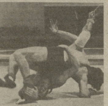
კატეგორიების მიხედვით დღეს გამოვლინდებიან ფინალური შეხვედრები 11 საათზე დაიწყება.