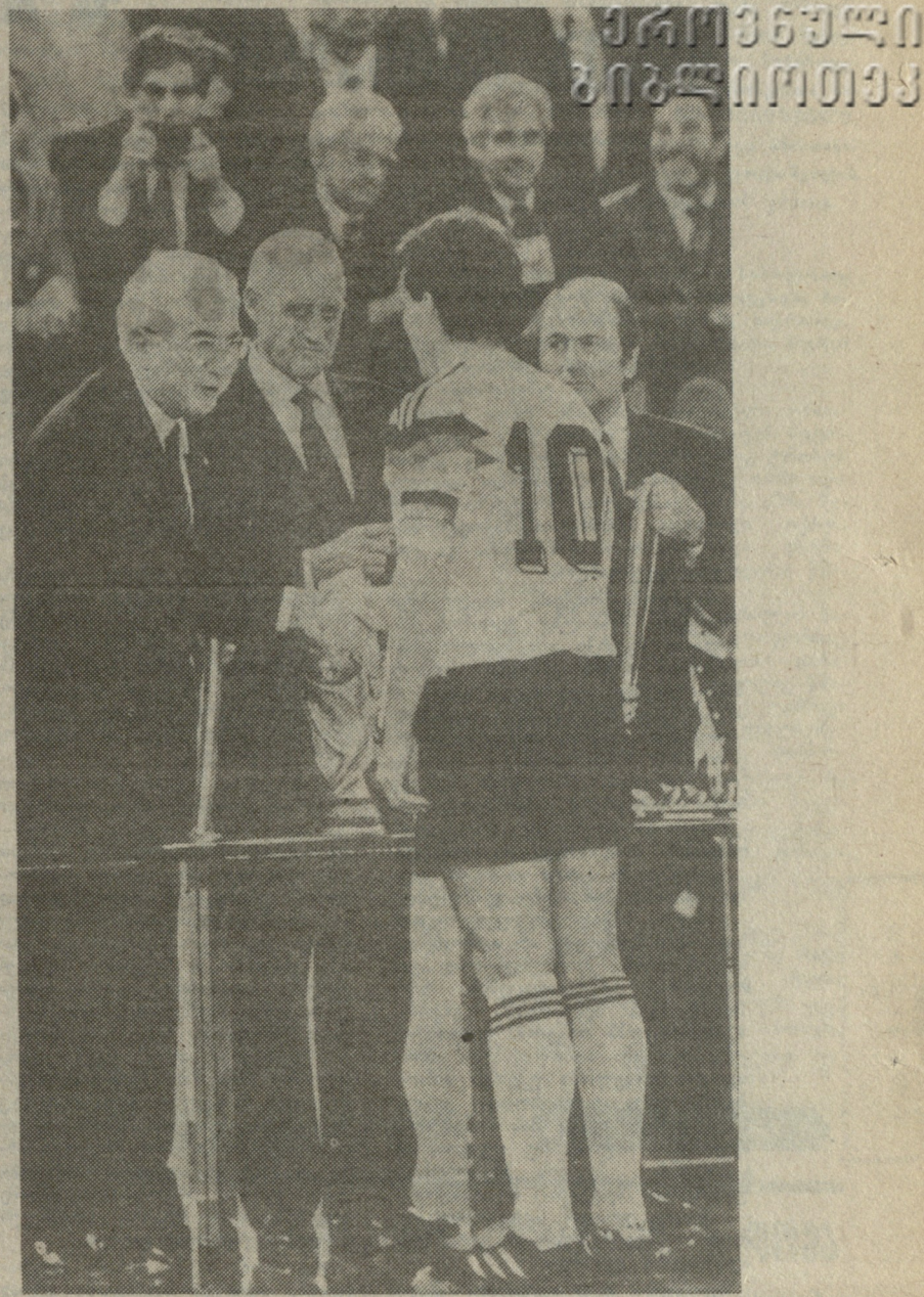
დრო ბადის, მაგრამ იტალიის მსოფლიო ჩემპიონატს ფეხბურთში კვლავ და კვლავ უბრუნდება მსოფლიო პრესა. ეს სურათი თვით „ფიფა-ნიუსმა“ გამოაქვეყნა ერთ-ერთ ბოლო ნომერში. იტალიის პრეზიდენტი ფრანკესკო კოსიგა (მარცხნივ), უილინსონი და ფიფა-ს აღმასკომის გენერალური მდივანი იოჟეფ ბლატერი ულოცავენ მსოფლიოს ჩემპიონს, გორის გუნდის კაპიტანს დეოტარ მათეუსს.