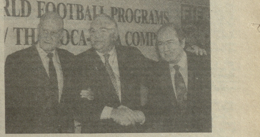
ფიფა-ს და „იოკა-კოლა“ ურთიერთანამშრომლობის პირველი ხელშეკრულება ჩერ კიდევ 1975 წელს გაფორმეს. როგორც ცნობილია, „იოკა-კოლა“ იუნორთა შორის მსოფლიო ჩემპიონატის სპონსორია. ხოლო თურქის ნიშნავს ასეთი ცნობილი ფირმის სპონსორობა სპორტში, თბილისელმა საკუთარი თვლით იხილეს 1985 წელს, როცა ჩვენმა დედაქალაქმა იუნორთა მსოფლიო ჩემპიონატის მატჩებს უმასპინძლა.