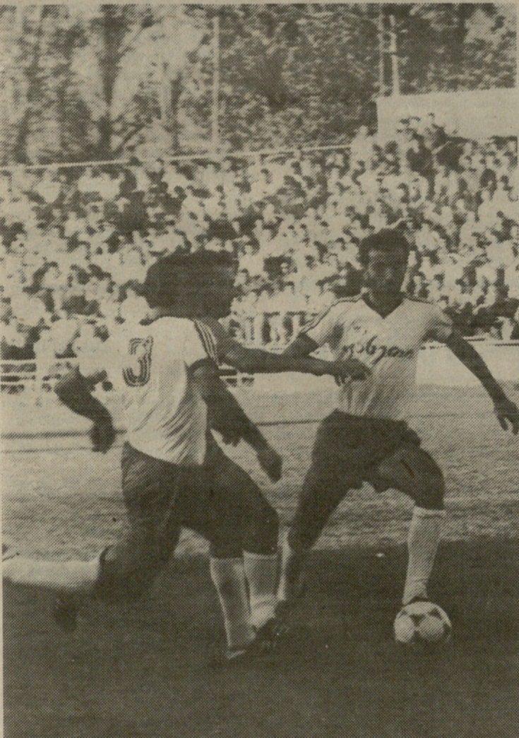
12 და 14 სექტემბერს გაიმართა საქართველოს ეროვნული ჩემპიონატის უმაღლესი და პირველი ჯგუფის მატჩები (იხ. მე-8 გვ.).

მოსახლეობის გაჯანსაღების ეროვნული ახლოციის შექმნის ხორგანიშნავი კომიტეტის წევრებს ვაუწყებთ, რომ მორიბი სხლოა გაიმართება ოქტომბრის, 26 სექტემბერს „ლელოს“ რედაქციაში.