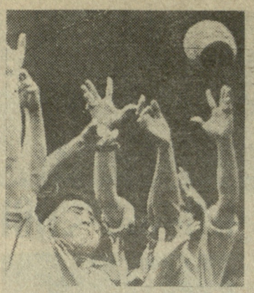
საპარტიკოსო XXIII ჩამოკიდების რაზმები