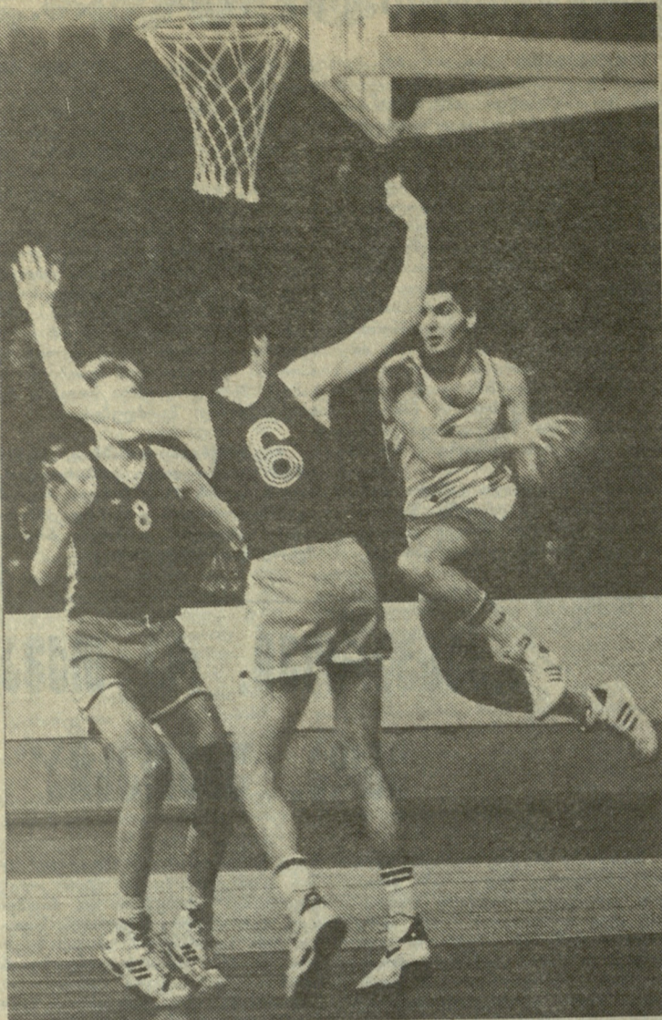
საპაპვირო ჩამვირთხევი კალათხურთში