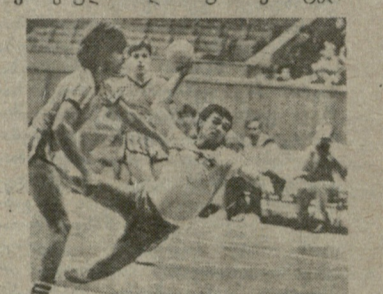
რეგიონალური ორგანიზაცია "თბილისი" და საწარმოო გაერთიანება "სამთო ქიმიკა" ფედერაციის უპირველესი ამოცანაა პრაქტიკულად დაეხმაროს რესპუბლიკის ხელბურთელ ვაჭთა და ქალთა გუნდებს...