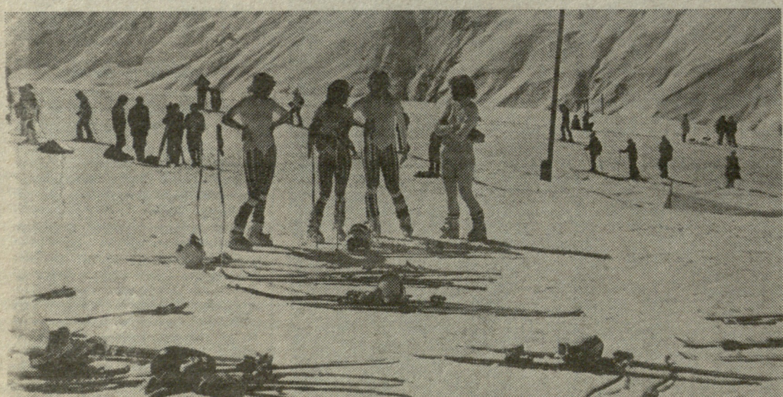
გულაური, თოვლი, სიხარული.