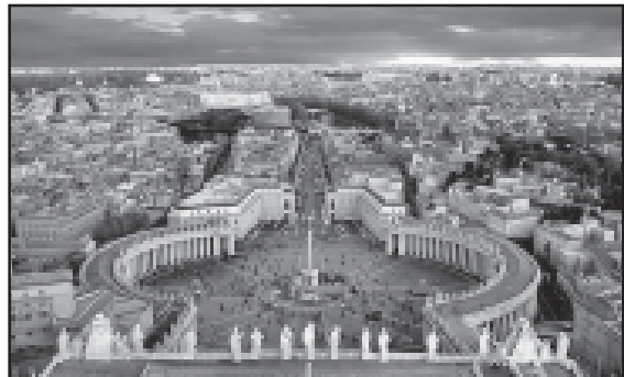
წელი სწორედ რომ გერმანული წარმოშობის იყო, უდალბა თავის გატონებს და აღარჩნდა ძალადის კარგი ბაულო „გარადიული ძალადი“ დაცვა დიმიტაროსმა გერმანელებმა სსტიკად ააოხრეს.

409 წელს გერმანული ტომის ვესტგოთების გალადა აღარჩნდა რომს ალყა შემოარტყა და უსიტყვო კაპიტულაცია მოსთხოვა. რომაელები კი ყოჩაღოდნენ, ძალად ერთმლიონინი მოსახლეობა ჰყავსო, რომელიც თითქმის კარგად დაცავდა თავს, მაგრამ აღარჩნდა არ მოტყუდა. „რაც უფრო ხშირია ბალსი, მით უფრო კარგი გასათიგია“. ასეც მოხდა. 410 წლის აგვისტოში რომში აჩუვდა მოწება, რომელთა ერთი ნაწილი სწორედ რომ გერმანული წარმოშობის იყო, უდალბა თავის გატონებს და აღარჩნდა ძალადის კარგი ბაულო „გარადიული ძალადი“ დაცვა დიმიტაროსმა გერმანელებმა სსტიკად ააოხრეს.