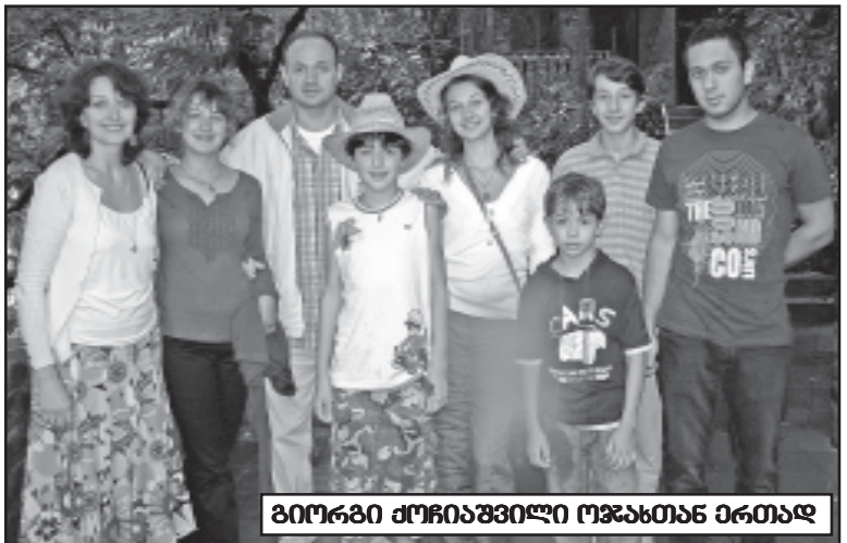
ბიოგრაფიის მინიშნული ოჯახთან ერთად

„დეისი“ კლინიკის მსოფლიო დონის სპეციალისტებთან ურთიერთობა ქართული ენის მითითებით მუშაობს და გამომწვევს სპეციალისტთან ბავშვთა რეზიდენტურის კურსს მომავალში მიმდინარეობს.