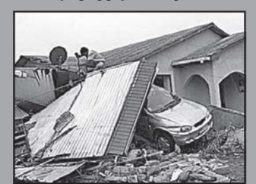
ჩილეში მიწისძვრის შედეგად დაზიანებული შენობა