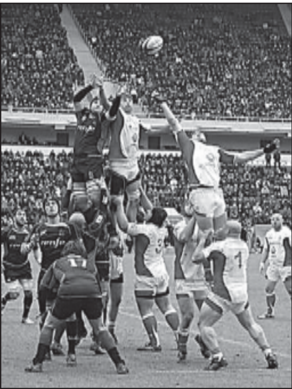
ნაგაზ ბასსა - 3:0. მასინძაძე...