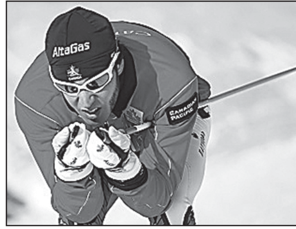
შანსი არ მისცეს