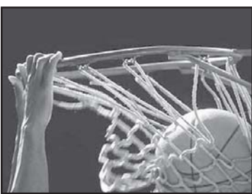
რაც შეეხება მანაძე...