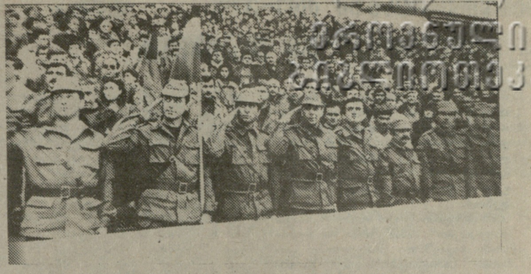
ეს ჩვენი დღევანდელია — ეროვნული ჩემპიონატის მატჩს ეროვნულ სტადიონზე უცხოტომელ ჩარისკაცთა ნაცვლად, ეროვნული გვარის წარმომადგენლები ესწრებოდნენ.

მატჩის დღეს ბათუმში, როგორც იქნა, გამოიარა და მშვენიერი სათამაშო აჩინდა დედა. სტადიონზე მოსულ გულშემატკი-