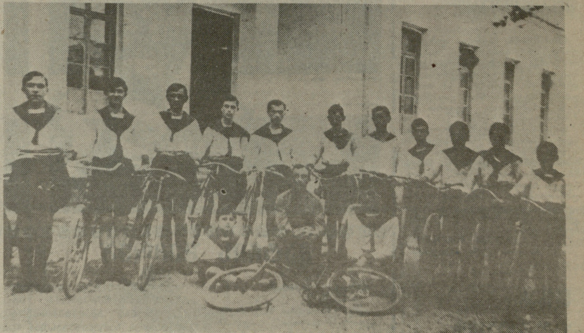
1920 წელი. ქუთაისის სპორტსაზოგადოება „შევარდენის“ პირველი ველოსექცია.

იმავ პერიოდში თბილისში ჩატარებულ ველოსიპედისტთა რესპუბლიკურ პირველობაზე ტრეკზე მოასპარევე სპორტსმენთა შორის ქუთაისელებმა მეორე საპრიზო ადგილი დაიკავეს. თუ მხედველობაში მივიღებთ იმ გარემოებას, რომ ქუთაისში ველოსპორტი მანამ კი არა, დღესაც ოცნების საგანს წარმოადგენს, დაგვეთანხმებით, რომ ქუთაისელთა მიღწევა დიდ წარმატებად უნდა ჩაითვალოს.