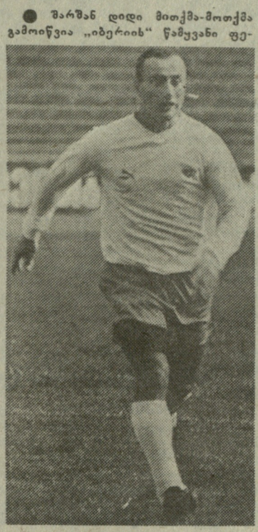
შარშან დიდი მითქმა-მოთქმა გამოიწვია „იბერიის“ წამუშავნი ფეხბურთელების მიწვევამ ვეროპის საკლუბო გუნდში.

ტრავმა ახსენეთ. პოლონელმა მწვრთნელმა გვითხრა, რომ გამოხატონიერებისთვის და ქორეოგრაფიული ჩარევა დაეკვირდა.