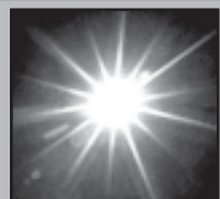
ამოდის 06.07 ჩაბის 18.09