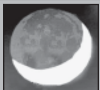
ამოდის 21.51 ჩაბის 07.22