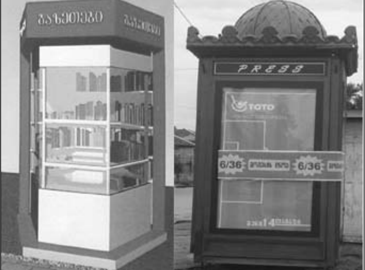
„ალიონის“ დასადგმელი ჯიბურის ესკიზი და „ჩანაცვლებული“ ჯიბური