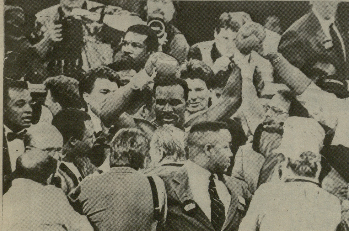
ევანდერ პოლიფილდი ბრძოლის შემდეგ.

ჯერ არ მოსულა, მაგრამ ცნობილია ბრძოლის შედეგი — ევანდერ პოლიფილდმა შეინარჩუნა ჩემპიონის ტიტული—მეტოქე დაამარცხა ქულეებით თორმეტრანდთან პაექრობაში. თანაც, საქმოდ მოკლე და ძუნწ ცნობაში ნათქვამია, რომ ფორმენს რამდენჯერმე ჰყავდა მოწინააღმდეგე ნოკდაუნში!