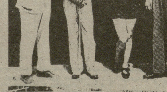
უორე კარბანტიე ამერიკელ კინომოდელაქეთა შორის პოლიედში. მა- რცხიდან — ქვე აღოდეგი, დერიდ ზანუი, ელის უატი და უორე კარ- ბანტიე.

მის სპორტულ ბიოგრაფიაში გან- საკუთრებით გამოირჩევა 20-იანი წლების დასაწყისი. 1920 წლის 12 ოქტომბერს კარბანტიე ქვემძიმე წო- ნაში მსოფლიო ჩემპიონის ტიტულ- ის მოსაპოვებლად შეხვდა ამე- რიკელ ბატლინგ ლევისსის, რომე- ლიც ორი წლით დარე გახდა ჩემ- პიონი, ფრანგმა მოკრევემ მეოთხე რაუნდის დასაწყისში უძლიერესი დარტყვით ძირს დასცა მეტოქე და