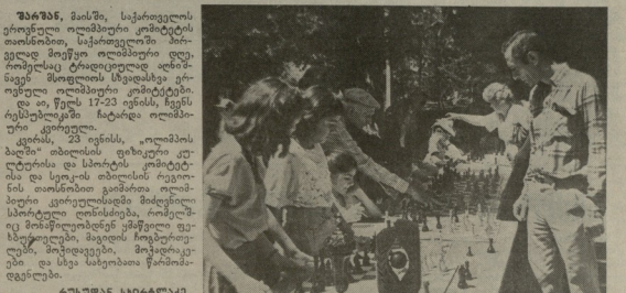
ზუზანი, მამია, სარქველის... კვირეულს მიეკისვება.