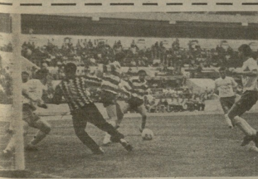
„ახვია“ — ხელოანი