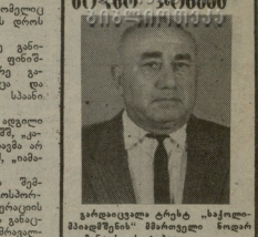
საქართველოს პარტიის პირველი მდივანი...