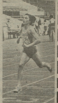
მან ხელაქა და მამლის ფორც...