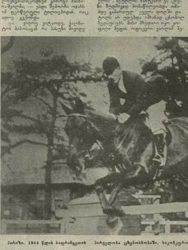
მამია, 1944 წლის ხაერბრევიტის პირველი ტენიონისა, სკოლები გრანაზე მხელს დადიანი.

განათლებლურ-მეცნიერულ-მედიკალურ და სხვა სფეროებში, რომლებიც მამიანი-სტალინიზმის წინააღმდეგობის მიზანმიმართული და ეროვნული დამოუკიდებელი ქართველები. ეს იყო ზუსტად არაფერი სხვა, რადგან არაფერი სხვა არ არსებობდა.