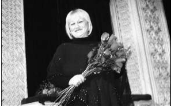
მასალას საღამოს შესახებ მომღვწევი ნომერში შემოგთავაზებთ