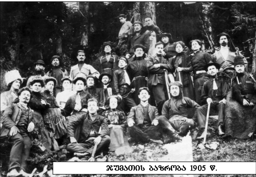
ჯუმათის ბაზრობა 1905 წ.