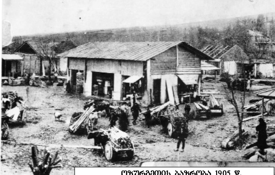
ოზურგეთის ბაზრობა 1905 წ.

ნაგომრისა ერთ-ერთ საუკეთესო ბაზრობად ითვლებოდა მთელ გურიაში. ვაჭრობისთვის ჩინებული დრო იყო შერჩეული-კათათვე. ეს ის დრო იყო, როცა გლეხი თითქმის მოცლილი იყო, რადგან სიმინდი უკვე გამარგალილი ჰქონდა და შეძლო ვაჭრობაში მონაწილეობა მიეღო თავისი ნაწარმით. ვაჭრობა გრძელდებოდა 15 დღე. სავაჭრო დღეები განთავსებული იყო ოზურგეთი-სამტრედიის გზატკეცილზე, მდ. სუფსის ნაპირას. საფარილო და სამიჩიტო დღეები ხისგან იყო აგებული და გზის იქით-აქეთ ნაპირზე იყო განლაგებული. ნაგომრის ბაზრობაზე თავს იყრიდა 10000-ზე მეტი ადამიანი. მთელ დასავლეთ საქართველოს წარმომადგენლობა აქ იყო: აჭარლები, იმერლები, სამეგრელოსა და აფხაზეთის, ახალციხის, მთიანეთ-რაჭის და სვანეთის მოსახლეობა. გურიის დაბალი ხალხი თითქმის მთელ წლის საკმარის ფართოლეულობას მაშინ ყიდულობდნენ. "გარშემო შემოაქეთ გასაყიდად ნაწარმი სოფლისა, ხილი, მწვანელი, ფროთოსანი, ოთხფენი, სხვადასხვა ნაქივები... თიხის ჭურჭელი, ქვევრები, კოკები, ღოჭები, მჭადის საცხობი კეცები. ბაზარშივე გამოაქეთ გათლილი ფიცრები. სხვათაშორის დიდძალი შემოაქეთ ურთხელის ფიცრები, თითო კარგად მოზრდილი 6 აბაზად იყიდება. 1808 წ. 25 ივლისს მამია გურიელმა და ქაიხოს-