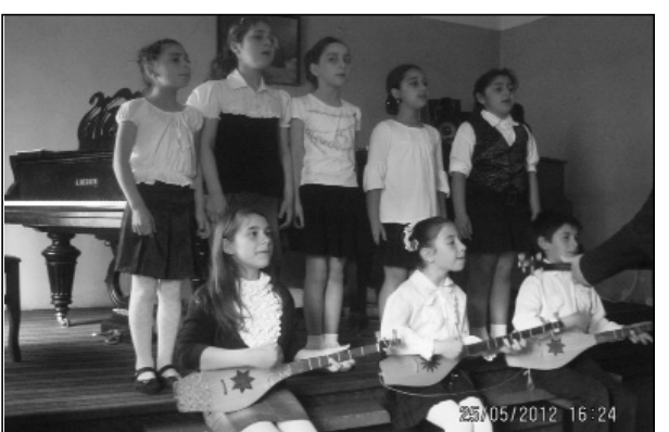
ოზურგეთის გრ. კილაძის სახელობის სამუსიკო სკოლაში საქართველოს დამოუკიდებლობის დღისადმი