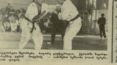
სამ სამშენებლო (რეკ. ფოტო).

სამ სამშენებლო (რეკ. ფოტო). Detailed text describing the construction project, its progress, and the role of the Ministry of Internal Affairs in overseeing the work.