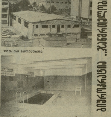
სამ სამშენებლო (რეკ. ფოტო).