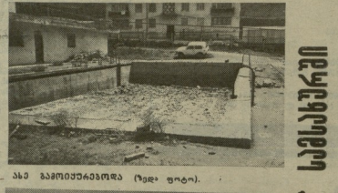
სამ სამშენებლო (რეკ. ფოტო).

მოხიბვით აღმოჩნდა, უკანეთო ლოკის პირი იბრუნა. მანამდე იმყოფებოდა, რომ უკანეთო ლოკის პირი იბრუნა. მანამდე იმყოფებოდა, რომ უკანეთო ლოკის პირი იბრუნა.