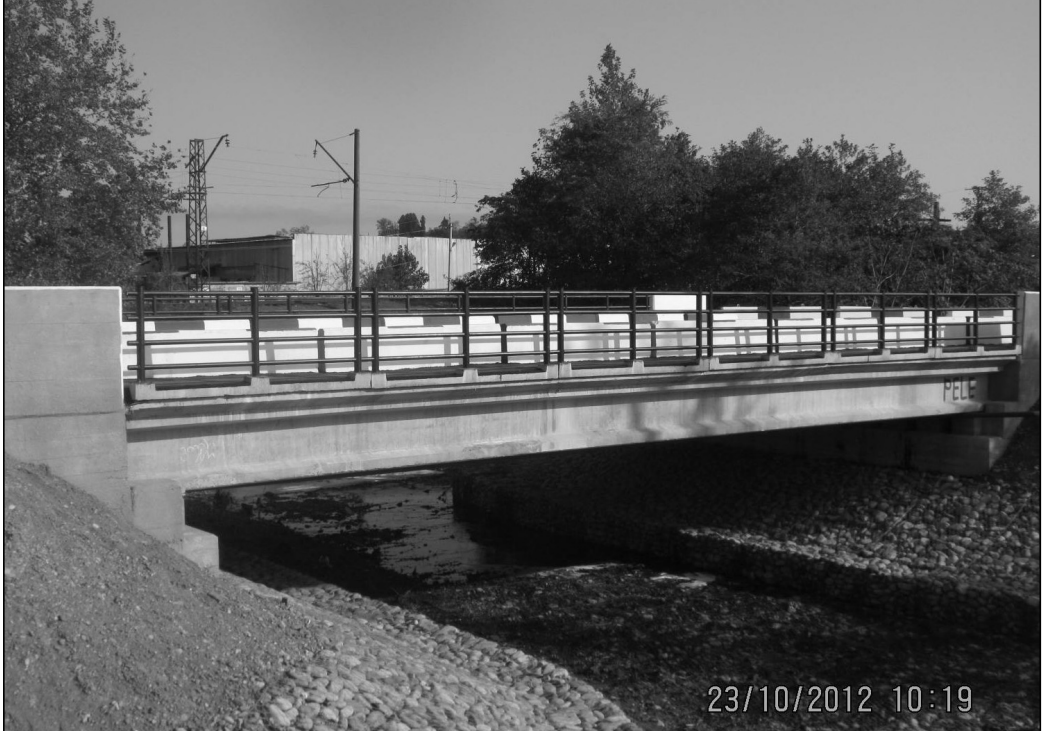
ხიდი მდინარე მერიაზე. (მშენებლები: შპს „ხიდშენი 99“, „გზამშენი 18“)