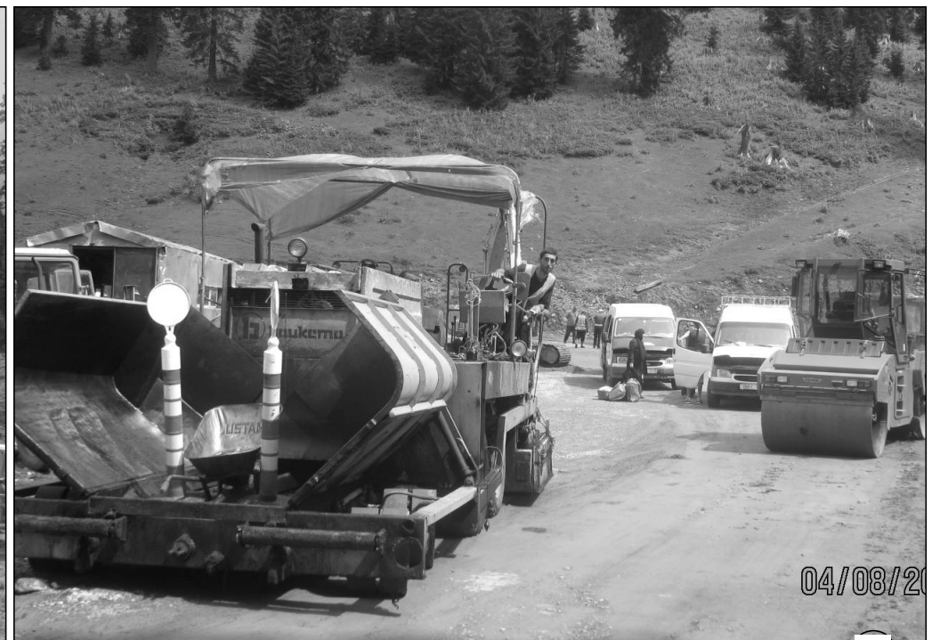
შპს „გზამშენი 18“ ბახმაროს გზის რეაბილიტაციისას.