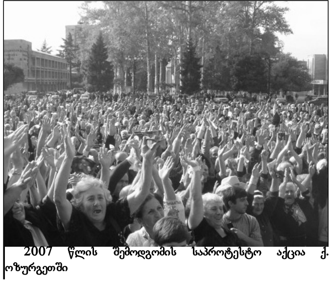
2007 წლის შემოდგომის საპროტესტო აქცია ქ. ოზურგეთში

2007 წელს „ნაცმობრობის“ საქმიანობისადმი მოსახლების ნდობის ფაქტორმა აშკარად იკლო. ადამიანებში გაძლიერდა პროტესტის გრძნობა გაუთავებელი „ნასარეცხების“ ძახილით, ეკლესიების ნგრევის გამო, ნაციონალური ელიტის მიერ არჩენებზე დაპირებების ფარატინა ქაღალდად ქცევის გამო.