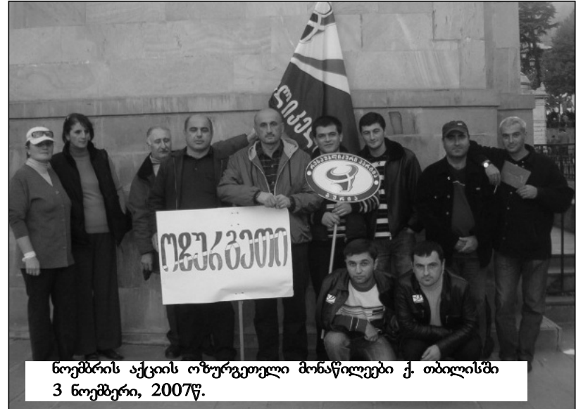
ნოემბრის აქციის ოზურგეთელი მონაწილეები ქ. თბილისში 3 ნოემბერი, 2007წ.