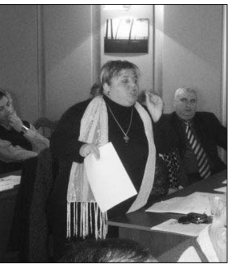
საკითხების გამო. კოალიცია ერთობლივად უნდა წვეჭტლეს საკანძო საკითხებს.