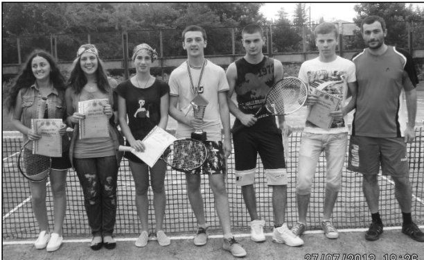
უახლოეს დღეებში ჩოგბურთის კორტებზე წელს რიგით მესამე ტურნირი გაიმართება. „მოდერნის“ თასზე დია პირველობა გაიმართება, რომლის განაცხადშიც უკვე არაერთმა ჩოგბურთელმა გამოთქვა მონაწილეობის სურვილი.