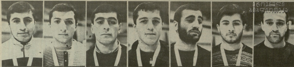
მხედრე უფლები, ბაგრატიონი, შალვა, კახიანი, კახიანი, კახიანი, კახიანი