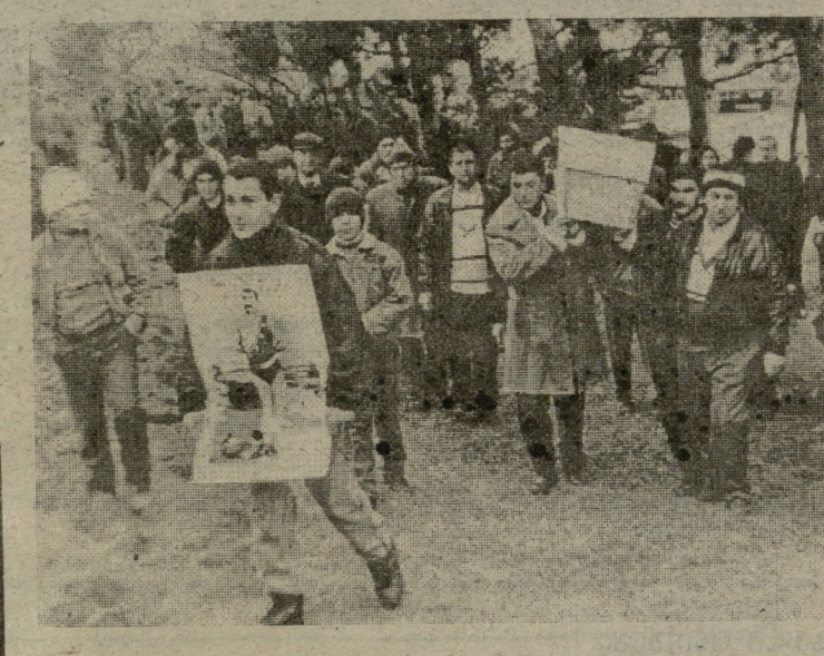
ვალაქთაგან კულა გლდანელის ნეშტი

სურათზე: ვალაქთ კულა გლდანელის ნეშტი.