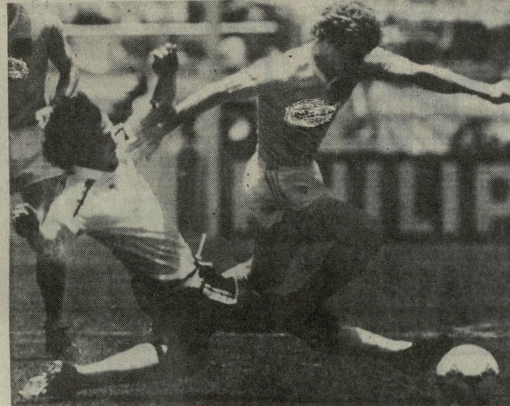
საბურთალოს „დინამო“ გუნდის ფეხბურთელი მატჩის დროს.

1995 წლის ნოემბრამდე აქვს დადებული კონტრაქტი. მის გუნდს ევროპის ჩემპიონატის ფინალში გასვლის საუკეთესო შანსი აქვს, მაგრამ არაბები ძალიან დიდ თანხას პირდებიან ა. იორდანესკუს.