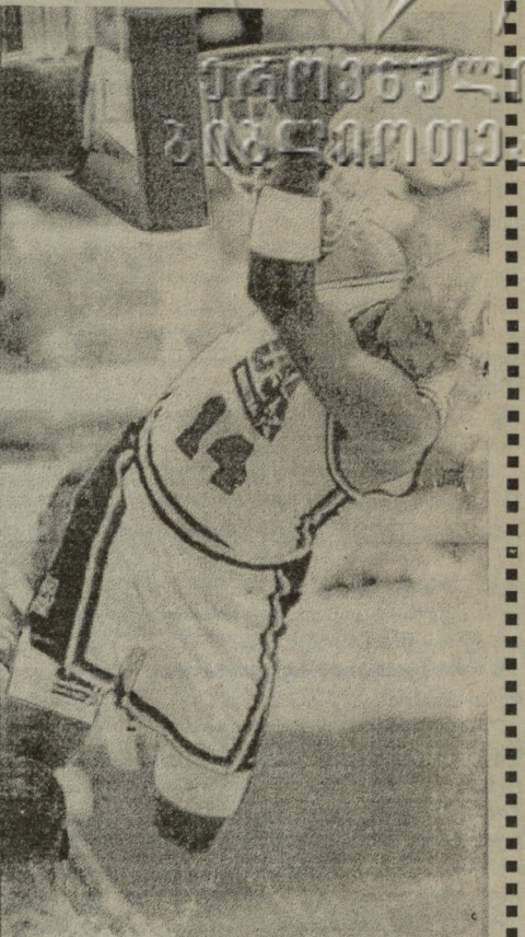
ჩარლზ ბარკლი აზია, იკითხავთ ალბათ? საქმის გახლავთ, რომ ჯონსონმა ლოს-ანჯელესის ერთ-ერთ რაიონში გახსნა თორმეტსართულიანი თეატრალური კომპლექსი სპეციალურად კალიფორნიის ფერადკანიანი მოსახლეობისთვის.