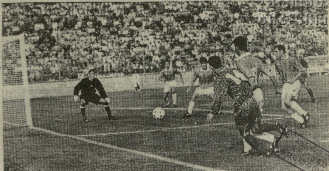
„ობილიჩის“ კარს უტეგს ბათუქის „დინამო“.

მკროპის საკლუბო ტურნირებში ჩვენი საი გუნდიდან შეიკლტოქა ეტაქსი მხოლოდ გათუქის „დინამო“ გავიდა. გათუქალთა ახალი მატოქა იქნება შოტლანდიის ქალაქ გლაზგოს „საკლტიპი“. პირველი მატოქა გაიგართოქა გათუქში 14 სექტემბერს, სპასუსო — გლაზგოში, 28 სექტემბერს.