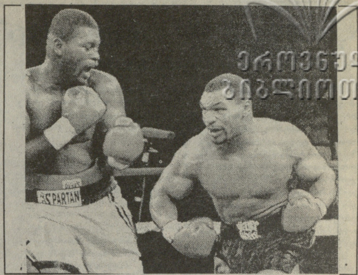
სურათში: მაიკ ტაისონი (მარჯვნივ) აშაღებს გადამწყვეტ დარტყმას ბასტერ მათისთან ორთაბრძოლაში.

როგორც გამოცხადდა, ტაისონის შემდეგი მეტოქე იქნება ფრენკ ბრუნო. სხვათა შორის, ბრუნო, ისევე როგორც კიდევ ორი სხვა მსოფლიო ჩემპიონი (მიმე წონაში, ოლონდ სხვადასხვა ვერსიით) — ბრიუს სელდონი და ფრენს ბოტა თვალყურს ადევნებდნენ ამ ბრძოლას ფილადელფიის „სექტორში“. შეხვედრის დამთავრების შემდეგ არც ერთ ჩემპიონს არ გამოუთქვამს თავისი მოსაზრება, თუმცა შე-