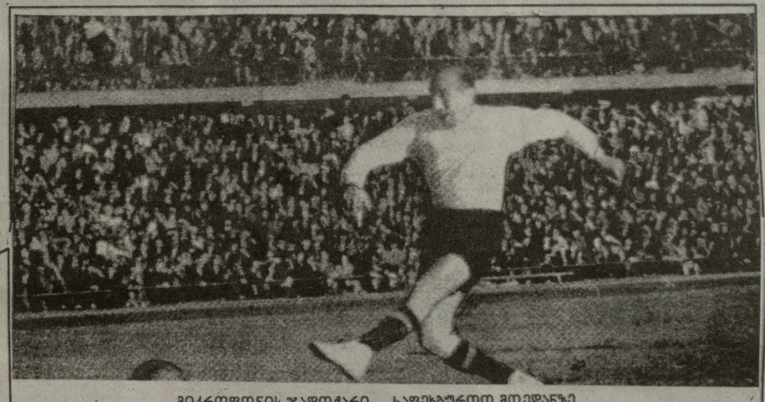
მიკროფონის ჯაღოქარი — საფეხბურთო მოედანზე.