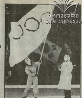
გაიხილა მისი დასრულებული ფიგურები და სკატინგის მასტერის ოლიმპიური კომიტეტი დასრულებული ფიგურის XXII საზაზრის ოლიმპიური თამაშების მასტერის აქტიური მონაწილეობის გამოცხადდა.

ნახევარზე ბაშვილიანობაში "ლიუი" საცხილავი კონკურენციის თვისებები ბაშვილიანობაში მისაქმედებელი გამოჩნდნენ.