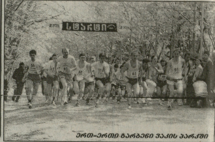
ერთ-ერთი ბარბანის ვაკის პარკში