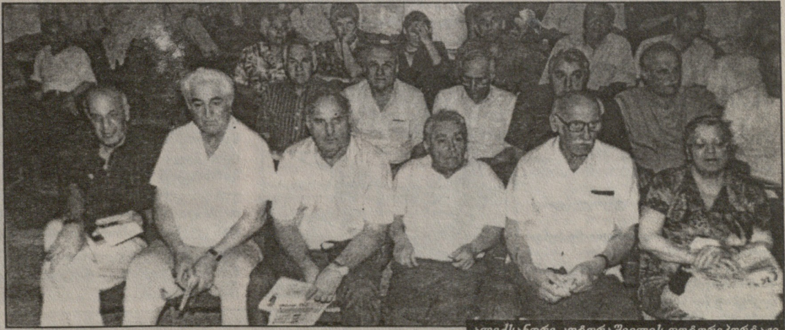
ალექსანდრე კოტორაშვილის ფოტორეპორტაჟი

კვლავაც გამარჯვებები ყოფილიყოს ქვეყნისა და ხალხის სამსახურში თქვენი სავიზიტო ბარათი.