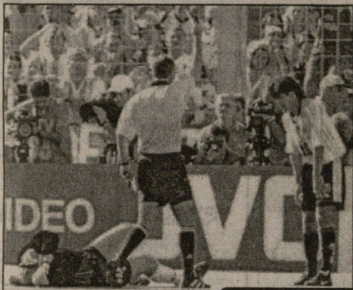
კოლანდია - არგენტინა