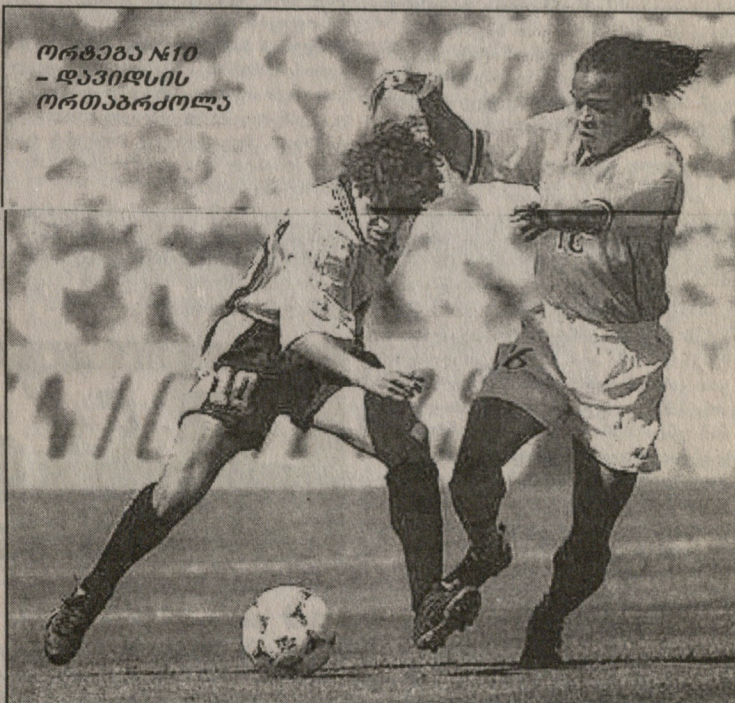
ორტეგა №10 - დავიდის ორთაბრძოლა