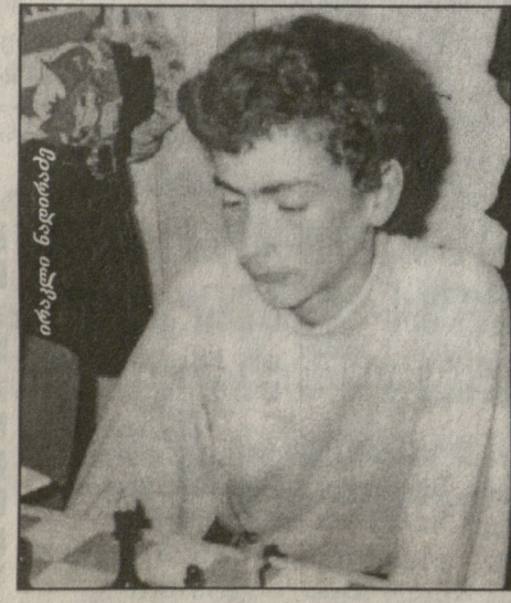
ამ დღეებში საპარტველო ჭაღრაკის შედარცინამ, საპარტველოს ბანათლებს სამინისტროს შიხიკში პლზრისა და სამხედრო მოზარდების მთავარმა სამმართველომ,