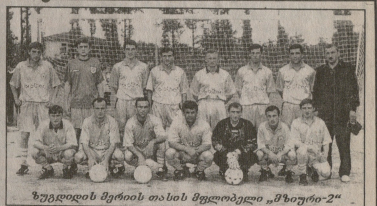
ზუგდიდის მერიის თასის მფლობელი „მზიური-2“

● და ბოლოს: ფეხბურთის გარდა თუ აპირებთ ბასკეთში რაიმე სხვა ამბითაც დაინტერესდებით? — ამჯერად მთავარი, მოგეხსენებათ მინც „ატლანტიკთან“ (ამ კლუბს წელს დარბებიდან 100 წელი უსრულდება) შეხვედრაა. ისე კი, თუ მასპინძლები ფეხბურთის გარდა რაიმე საინტერესო შემოგთავაზებენ ჩვენი ორი მონათესავე ხალხის კარგად ცნობილი საკითხის ირგვლივ, ცხადია, დიდი სიხარულით შევხვდებით ამას.