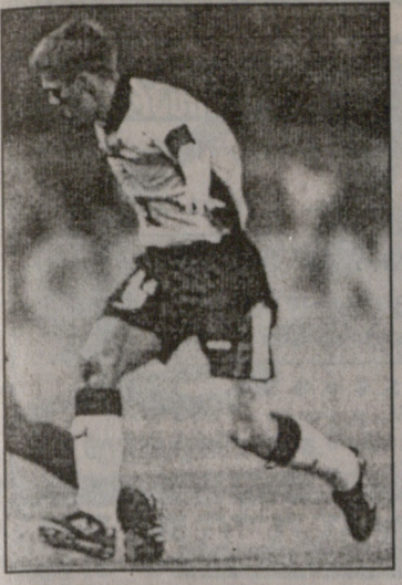
ოუანა «მოსნა» რონალდოს რაკორდი

„ლივერპულმა“ გადაწყვიტა 60 მილიონ გირვანქა სტერლინგად (დაახლოებით 100 მილიონ დოლარად) დაზღვიოს თავისი სუპერვარსკვლავი მაიკლ ოუენი. ეს თანხა კი დაადგინეს ოუენის საორიენტაციო სატრანსფერო ფასითა და იმ შემოსავლით, რომელსაც მისიურებისა და სხვა სუპერნიგების გაყიდვა მოიტანს. აქამდე ყველაზე დიდ ფასად — 50 მილიონ გირვანქა სტერლინგად რონალდო იყო დაზღვეული.