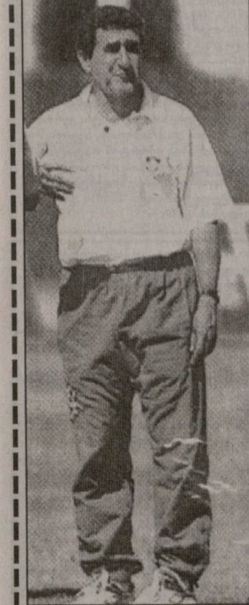
პარლოს ალბერტი პარეირა (ბრაზილია)

1994 წელს ბრაზილიის ნაკრებთან ერთად მსოფლიო ჩემპიონი გახდა. წლეულს საუდის არაბეთის ნაკრებს ხელმძღვანელობდა. საერთოდ კი, როგორც მწვრთნელი, მსოფლიოს 6 (!) ჩემპიონატში მონაწილეობდა. პარეირა თვლის, რომ ნებისმიერი