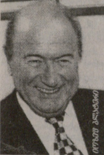
ანუ 1998-2000 წლებში იმუშავებს ფიფაში. აი, აღმასრულებელი კომიტეტის სრული შემადგენლობა.