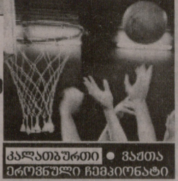
კალათბურთი • გათაჟ ეროვნული ჩემპიონატი