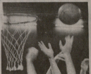
იხ. მე-2 გვ.