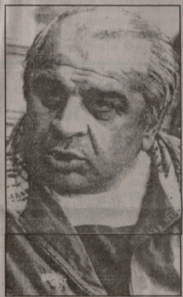
იხ. მე-5 გვ.